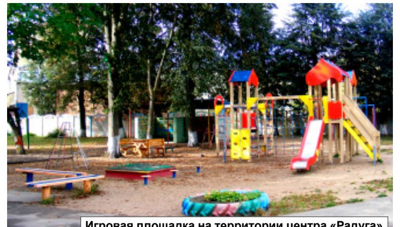
Игровая площадка на территории центра «Радуга»