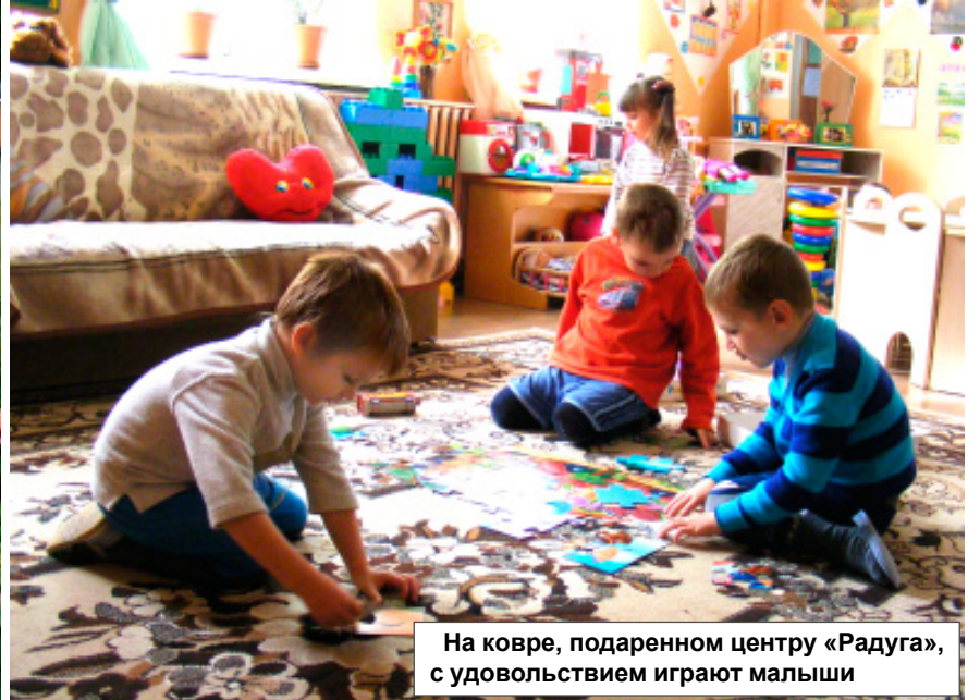
На ковре, подаренном центру «Радуга», с удовольствием играют малыши